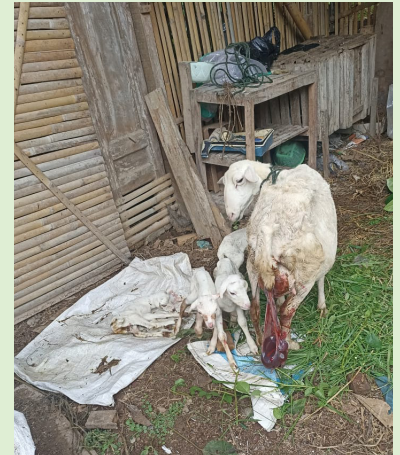
Anak kambing yg baru lahir akan diberi ke anggota Sangu Gesang yg lain.