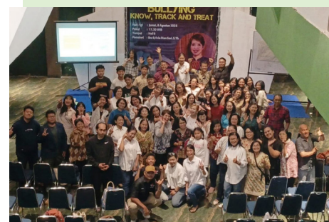
Sesi training yg dihadiri banyak orang

Kabar berita SRI juga di muatkan di website kami. Setelah salah satu relawan selesai dengan terjemahannya, kabar berita juga dapat di bacakan dalam bahasa Inggris maupun bahasa Belanda: sri-indonesie.nl/newsletter/ sri-indonesie.nl/nieuws/