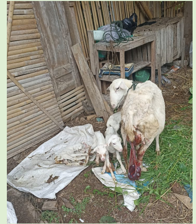
Het pasgeboren geitje zal naar een van de andere vrouwen gaan.