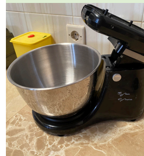
De aangeschafte keukenmachine.

Solo soep voor iedereen tijdens de jaarvergadering van vrouwengroep Lidia. De groepsfoto mag uiteraard niet ontbreken.