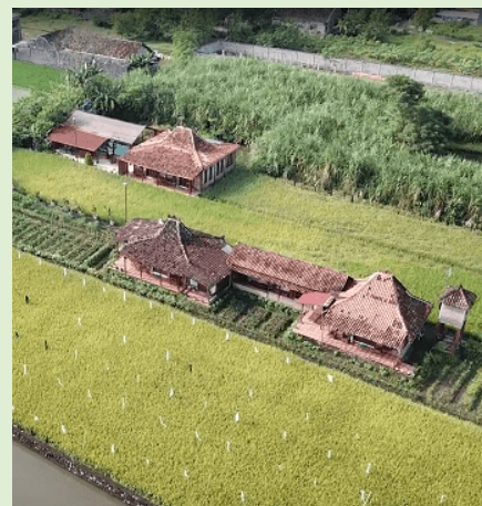
'Thuiskomen' bij Alamanda Village.