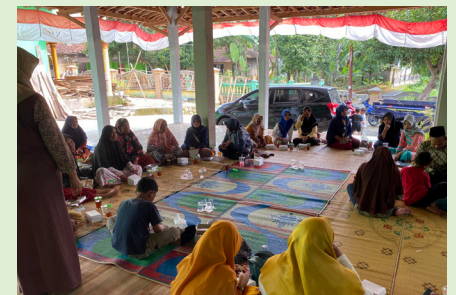
Bijeenkomst vrouwengroep Sangu Gesang.

SRI ondersteunt van deze vrouwengroep 4 kinderen met hun scholing.